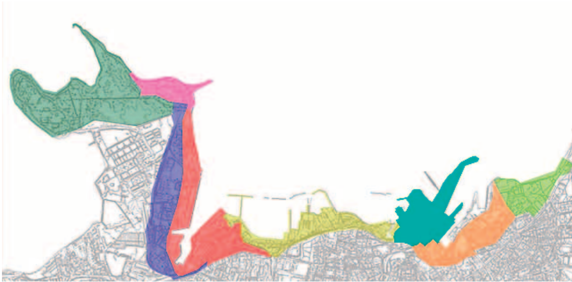
Paljassaare ja Russalka vahelise rannaala üldplaneering http://veeb.tal-linn.ee/rannaala/ranna_web